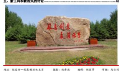
网址: 规划处-发展规划处主页 编辑: 陈淑萍 审核: 马占河