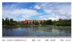
网址: 规划处-发展规划处主页 编辑: 陈淑萍 审核: 马占河