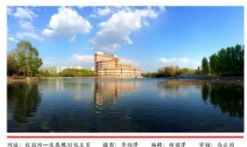
网址: 规划处-发展规划处主页 编辑: 陈淑萍 审核: 马占河